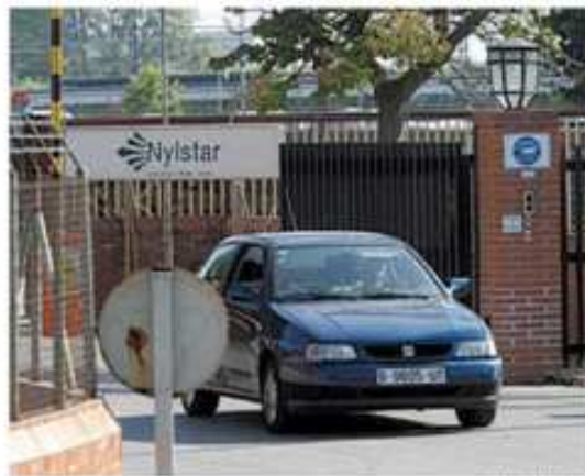
La entrada a la fábrica de Nylstar en Blanes