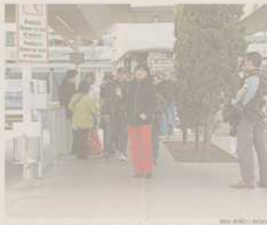
Un grupo de trabajadores saliendo de la empresa

El sistema que ha puesto en marcha la corporación es la más parecido a las colonias industriales del textil en el siglo XIX. Además de ofrecer un sueldo (1.200 euros mensuales), la compañía facilita el visado de alquiler a menos de 300 euros al mes. Guissona cuenta con